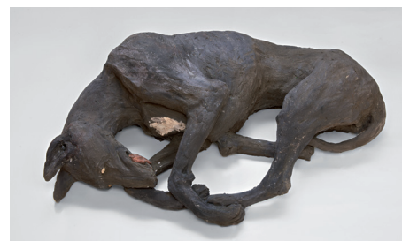
Caterina Marinelli Podenco Canario, 2015 Terracotta, cm 20x80x54 Collezione privata