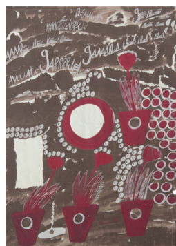
Carlo Zinelli Senza titolo, 1961 Tempera su carta cm 70x50 Collezione privata