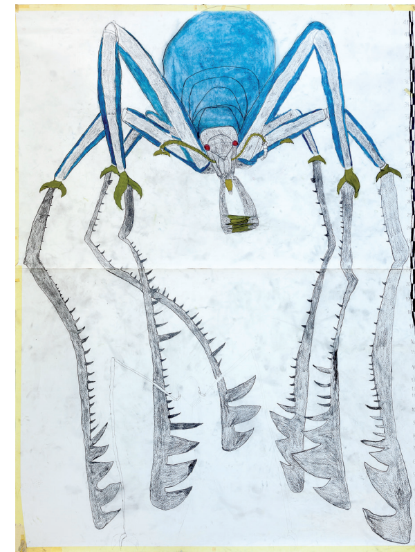
Niccolò + Nuru + Nicolas + Luca RagnoFerro di Curnasco, 2015 Stampa su materiale plastico, cm 700x500 Atelier dell'Errore