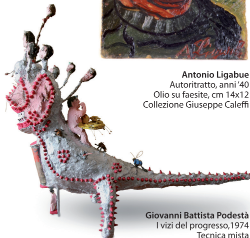
Giovanni Battista Podestà I vizi del progresso, 1974 Tecnica mista cm 120x97x38 Galleria Rizomi_art brut