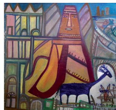
Bonaria Manca Tempio Enkoe, 2000 Olio su tela, cm 210x210 Proprietà dell'artista